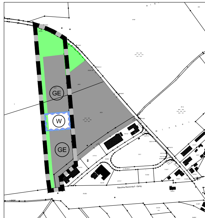
Änderungsplan M 1: 5.000 mit Darstellung bisheriger Flächennutzungsplan